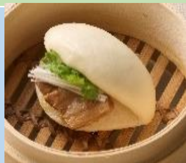
粉からこだわる 包バンズ 規格:(400g(10個)×6)×2