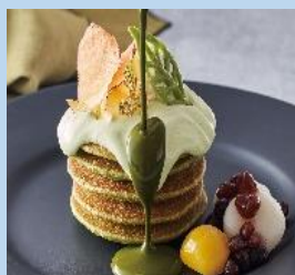
自然解凍ミニパンケーキ 抹茶味 400g(20枚)×10×2