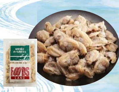
旬獲り限定ボイルあさり 規格:400gx20