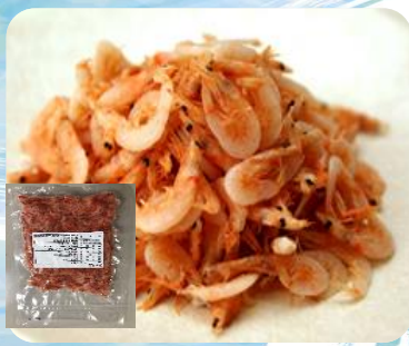
釜揚げ桜えび(台湾産) 規格:200gx50