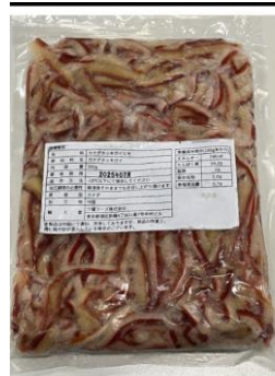
カナダほっき貝ひも