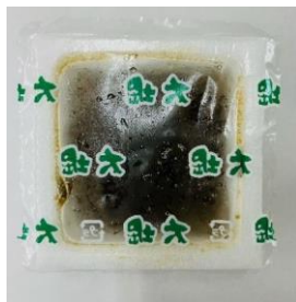
味付けもずくポーション