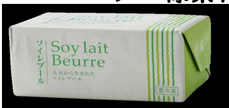
ソイレボール 豆乳クリームを使ったクリーミー感 植物油脂のくちどけ