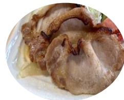
豚ロース生姜焼き 1kg x 10