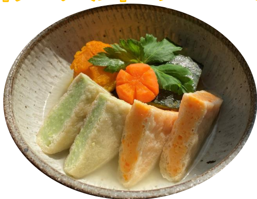
彩りミニいなり (にんじん/枝豆) 規格：700gx20