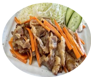
焼肉牛カルビ 1kg x 10