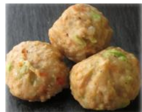
大豆ミートの野菜入りボール 大豆で作ったミートボールのような素材です 動物性原料 不使用です