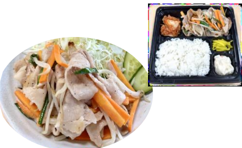
にんにく豚塩カルビ 1kg x 10