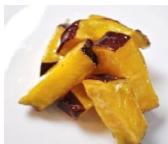
大学芋 (スティックカット)