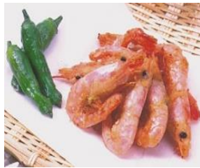
甘えび唐揚げ 1 k g x 4 x 2 約200尾±40尾 / k g 中 (目安)