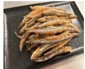
米粉を使った きびなご唐揚げ 1 k g x 10 長崎 (五島列島) 原料 150~190尾/袋 (目安)