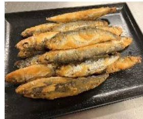
小いわし唐揚げ (スプラット) 1 k g x 6 x 2 80~100尾/袋 (目安)