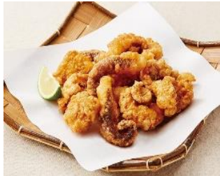
たこ唐揚げT 500 g x 10 x 2 岩タコ使用