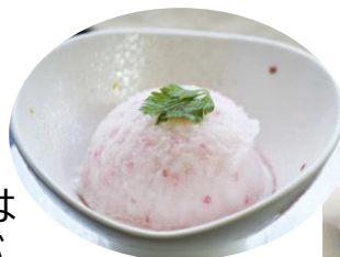
フィンガーライム 規格：300 g x 8