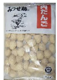
みつせ鶏肉だんご 規格：1 k g x 6 p みつせ鶏 (九州産赤鶏) を使用