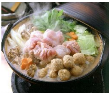
華味鳥つくねN12g 規格：1kg x 12P 九州産華味鳥使用の丸型つくね