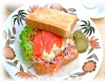
スモークシルバーサーモンカットオフ500ABM 規格：500 g x 10 x 2