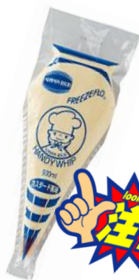
カスタード風味 ホイップ