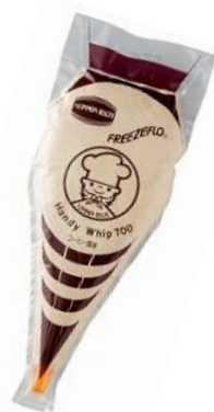
コーヒー風味 ホイップ