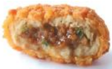
はかた地鶏の柚子味噌 包みのメンチカツ 75g/60x2