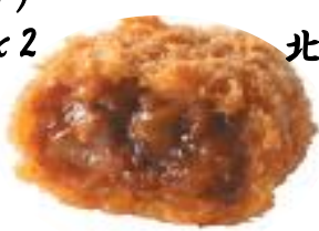
北海道産バター使用 ビーフシチューコロッケ 40g/15x8x2