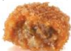
すき焼き風コロッケ (国産牛入り) 45g/15x6x2