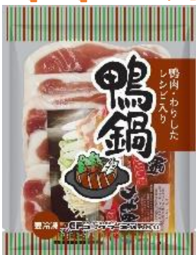
あひ鴨鍋セット 230g x 30