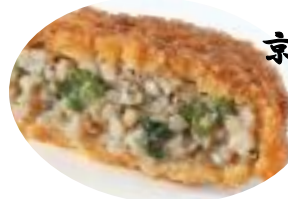
京都府産九条ネギ 入りメンチカツ 45g/15x6x2