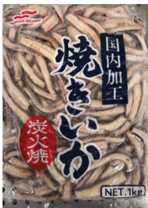
焼きいか(炭火焼) 規格：1kg/6x2