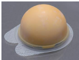
ポーションアイス

季節のお奨め！ マンゴー ココナッツを使って ごろっと果実をかけるだけでボリュームUPと付加価値UPです