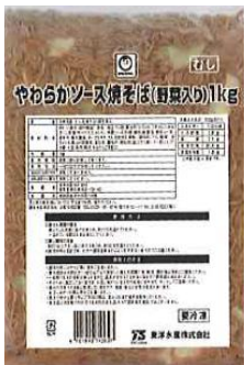
やわらかソース焼きそば (野菜入り)