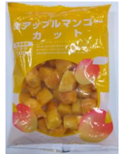
トッピングに 冷凍マンゴー