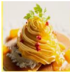
マンゴー パンケーキ