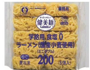
「健美麺」学給用食塩ゼロ ラーメン(国産小麦使用)200