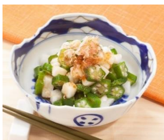
規格：500g x 10 x 2