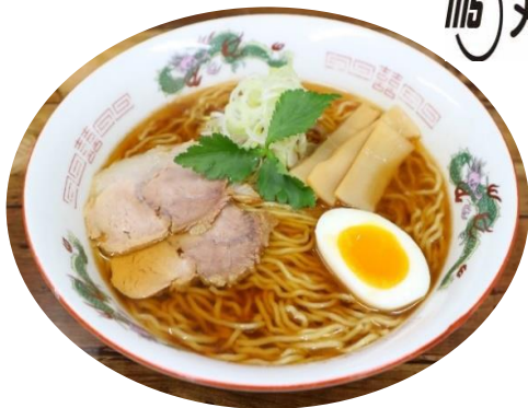
体にやさしいラーメン 如何でしょうか？