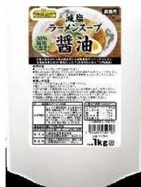
特級厨师減塩 ラーメンスープ醤油 (1kg x 10)