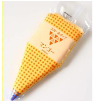
ホイップdeマンゴー 規格：600ml x 20